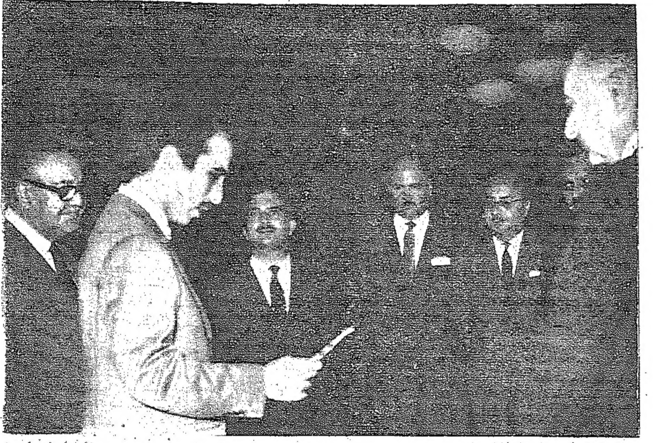
سمو الامير محمد يؤدي التهنئة الدستورية كاتبة لجلالة الملك العظيم

غزة - خاص بالدستور - تؤكد الانباء الواردة من قطاع غزة ان القوات الاسرائيلية ما زالت تتابع اعمالها الوحشية ضد السكان العرب في المنطقة . فقد قامت هذه القوات بحملة مسعورة ضد المشائر البدوية في منطقة رفح والبيوك جنوب شرق خان يونس على اثر اختفاء احد ضباط الاستخبارات الاسرائيلية ومعه احد العملاء .